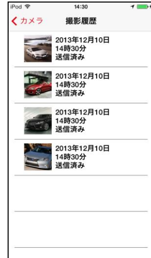
撮影写真一覧画面