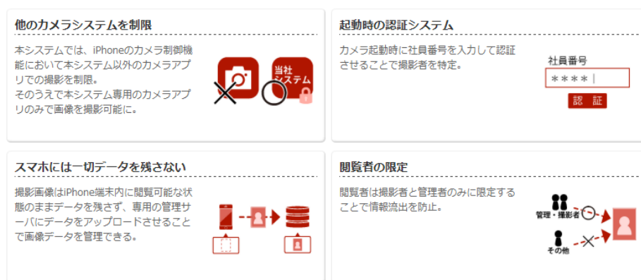
図：システムの特徴